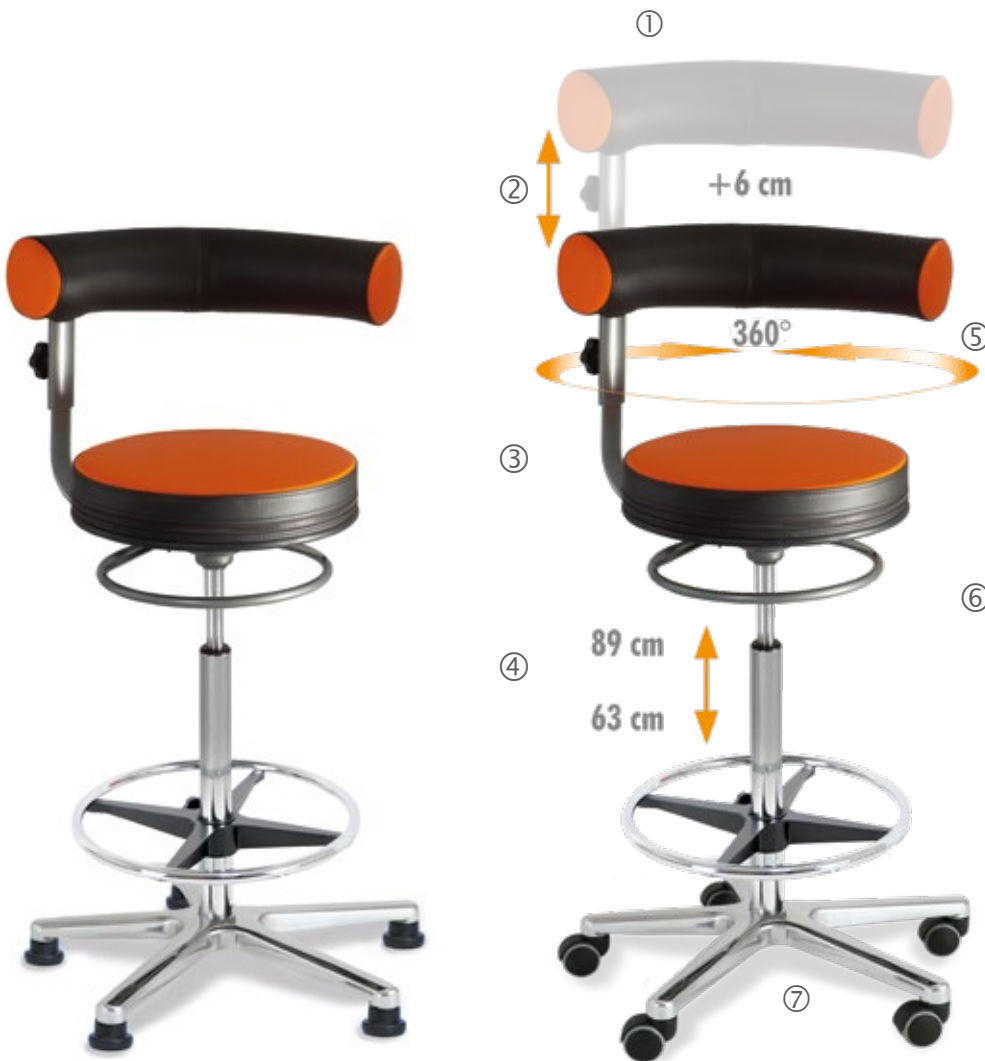
Gleiter / floor gliders